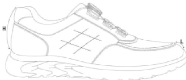
图3 成品尺寸测量部位示意图